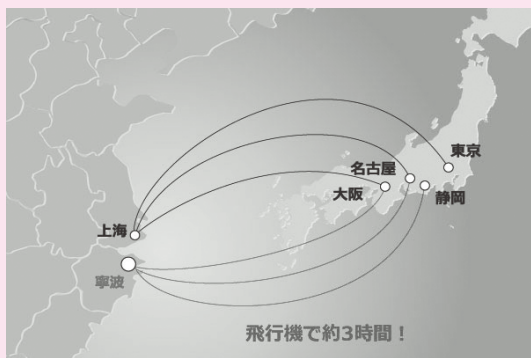
(寧波観光局公式サイトから)

寧波市は中国浙江省の東部に位置し、杭州湾を挟んで上海の南方にあります。面積は9,816km 2 、人口は800万人です。沿海部の港湾都市として商工業が発達していますが、同時に古い歴史を誇り、歴史文化名城に指定されています。唐・宋から海外貿易で栄え、早くから日本との往来が盛んでした。遣唐使が中国大陸への上陸港として目指した寧波港は、長い歴史を持つ中国港のひとつです。