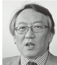
か りゅう 柯 隆

1959年山梨県甲府市生まれ。1981年中央大学法学部政治学科卒。NHKに入局し、福島・青森両放送局記者を経て報道局政治部記者。中曽根総理番を手始めに政治取材に入り、法務省、外務省、防衛省、与野党などを担当。首相官邸キャップ、政治部デスクを経て2001年から解説委員。2006年より12年間「日曜討論」キャスターを担当。2018年に解説副委員長から現職の名古屋拠点放送局長に転じる。